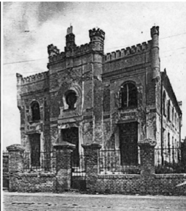
Синагога Береттьоуфалу, 1945

Имя скончавшегося в Будапеште Дьердя Конрада мало что скажет постсоветскому читателю. Между тем его книги переведены на множество языков, он возглавлял Международный ПЕН-клуб и удостоился высших государственных наград Венгрии, Франции и Германии. А еще он был диссидентом, моральным авторитетом и... евреем.