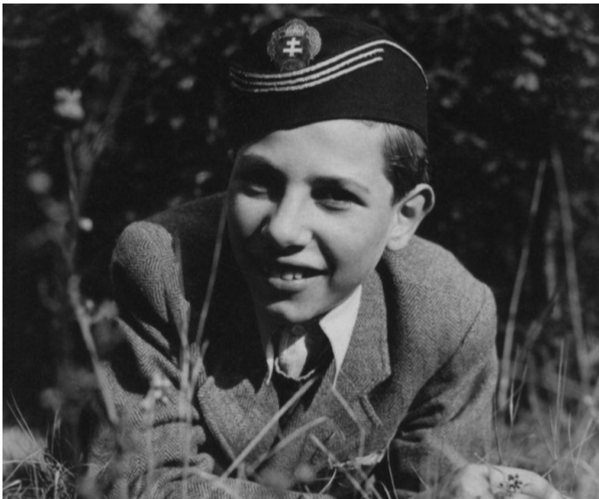
Писатель в детстве.

В 1977-м вышли повести Кертеса «Следопыт» и «Детективная история». В 1988-м он издает книгу «Фиаско», еще через два года появляется «Кадиш по нерожденному ребенку» — последняя книга в трилогии об одиссее Имре Кертеса. «Когда я начинаю думать о новом романе, — признавался он, — это всегда начинается с мысли об Освенциме... Начать жить заново нельзя. Я продолжаю жить той же самой своей обезжизненной жизнью». Протагонист книги — тот же персонаж, ставший мужем красавицы-еврейки, рожденной после войны и мечтающей о ребенке. В ответ женщина многократно слышит резкое «нет», мотивируемое страхом мужа иметь детей в мире, где возможен Холокост: «Никогда с другим ребенком не должно произойти то, что произошло со мной... А если он потом скажет: «Не хочу быть евреем?»»