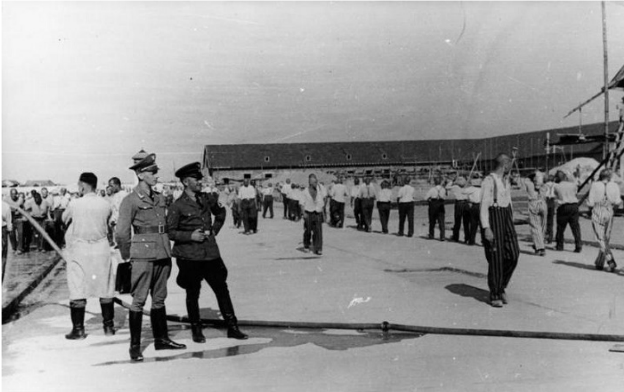
Концлагерь Заксенхаузен, 1938

До поры до времени пастор оставался на свободе — не в последнюю очередь благодаря влиятельным друзьям из числа своих прихожан. Кроме того, он уже весьма известен и не обойден вниманием иностранной прессы.