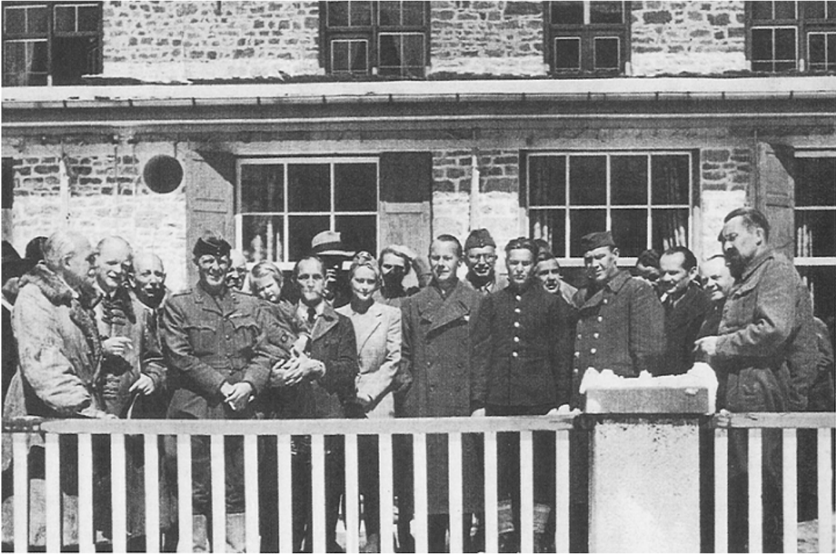
Пастор Нимёллер (с трубкой во рту и ребенком на руках) после освобождения из Дахау, 5 мая 1945

После освобождения пастор вернулся в церковь Святой Анны в Далеме. В 1950-х милитарист Нимёллер перешел на радикально пацифистские позиции, не уклоняясь от сотрудничества с коммунистами, против которых выступал сразу после войны. В 1957 году священника избрали президентом Немецкого общества защиты мира, а в 1958-м — главой Интернационала противников военной службы. По мнению пастора, военная служба несовместима с христианской верой, он даже назвал подготовку солдат «высшей школой для профессиональных преступников».