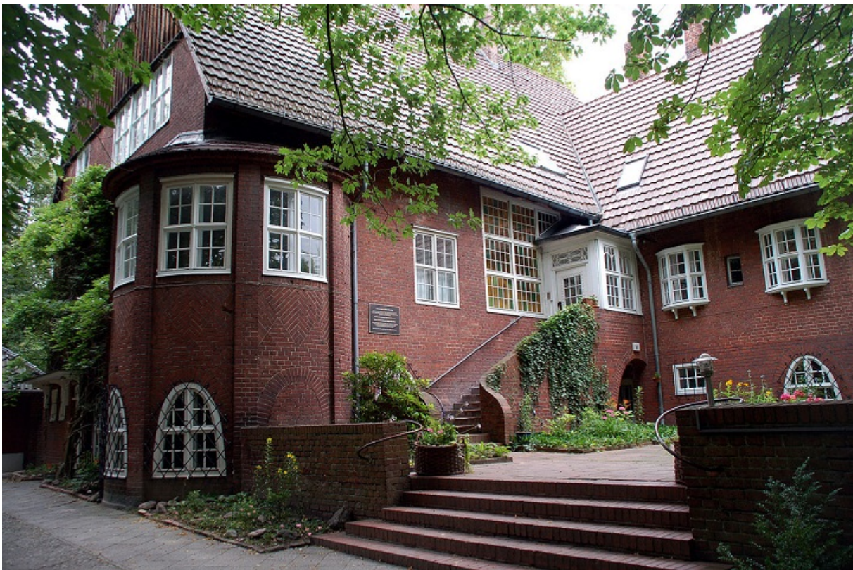
Дом-музей Мартина Нимёллера в квартале Далем

После войны Нимёллер призывал протестантскую церковь Германии раскаяться за своё соучастие в преступлениях нацистского режима. В 1961 году он избирается одним из президентов Всемирного совета церквей.