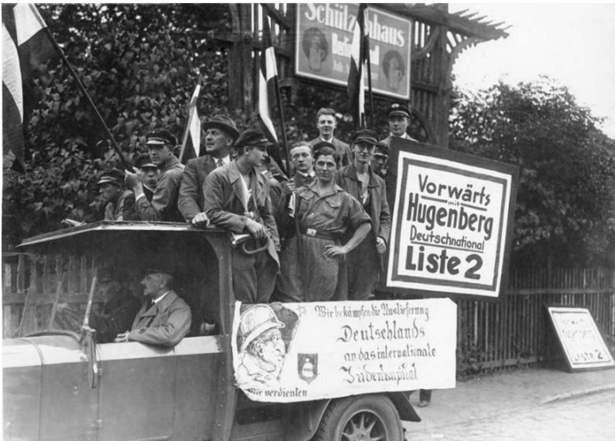
Предвыборная кампания Немецкой национальной народной партии под антисемитскими лозунгами