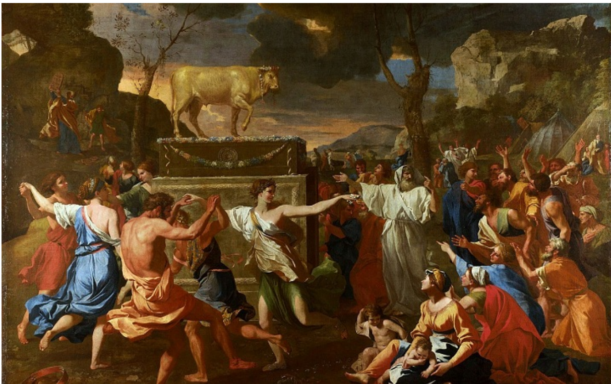
Пляски вокруг золотого тельца, худ. Никола Пуссен, 1633 - 1637

Великий еврейский мистик Баал Шем Тов считал наиболее милыми для Господа обычных евреев — простэ идн. Среди них настроения двойственные. С одной стороны, афера Мэдоффа — это шанде — еврейское слово, означающее позор, причем, публичный. С другой — многие вспоминают, каким Берни был а-мэнч, человеком с большой буквы, как не любил себя выпячивать, как щедро жертвовал на Израиль и помогал «бедным» богатым вдовам и сиротам. Рассказывают, как он содержал пожилую вдову одного из первых вкладчиков, бродит также история о щепетильных Берни с женой, раскладывающих в почтовые ящики соседей извинения за неудобства, доставленные аферой.