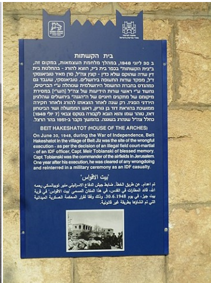
Памятная доска на здании, у которого был расстрелян Тувианский