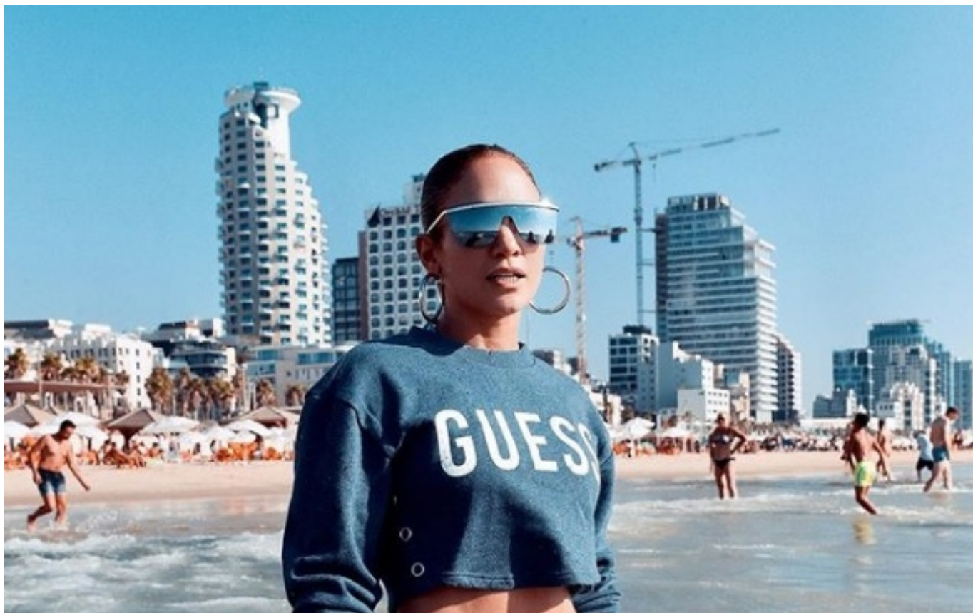
Дженнифер Лопес в Тель-Авиве

Справедливости ради надо заметить, что Роджер верен себе не только в ненависти к Израилю, он последовательно поддерживает режимы, которые кажутся ему «прогрессивными». В прошлом году он обвинил Соединённые Штаты в попытке уничтожить «венесуэльскую демократию». В знак благодарности президент Николас Мадуро подарил рокеру гитару.