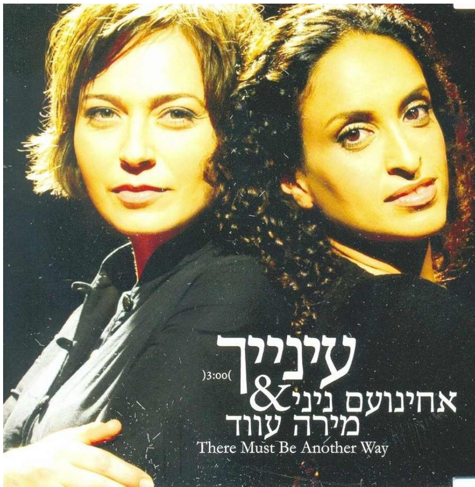
Мири Авад и Ахиноам Нини на обложке совместного альбома

Мири родилась в северной Галилее, ее отец — израильский араб, врач по профессии, а мать — христианка из Болгарии. Петя девочка начала в раннем детстве, в 9 лет дебютировала на большой сцене, исполняя арабскую и болгарскую традиционную музыку, а также популярные композиции своих любимых групп, в том числе Pink Floyd.